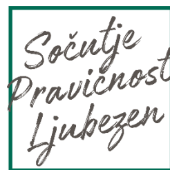
Slika 1: Moto organizacije ADRA

Ker verjamemo, da ima vsak človek pravico do dostojnega življenja, z zaupanja vrednim in učinkovitim delom skrbimo za najbolj ranljive posameznike ter skupine v Sloveniji in tudi po svetu.