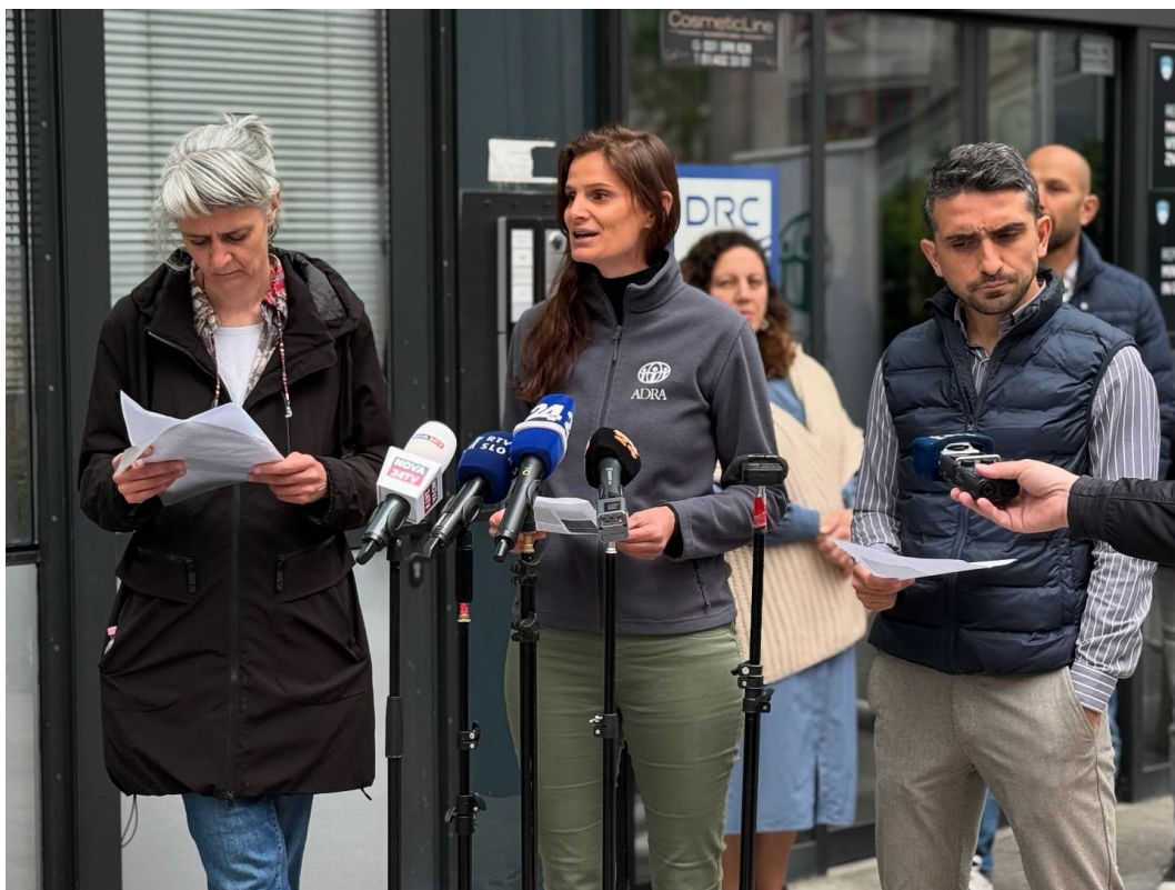
Slika: Tiskovna konferenca ob javni pobudi