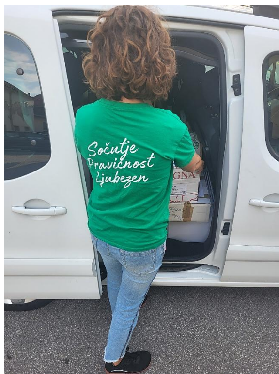
Slika: Prostovoljka z majico in motom ADRA