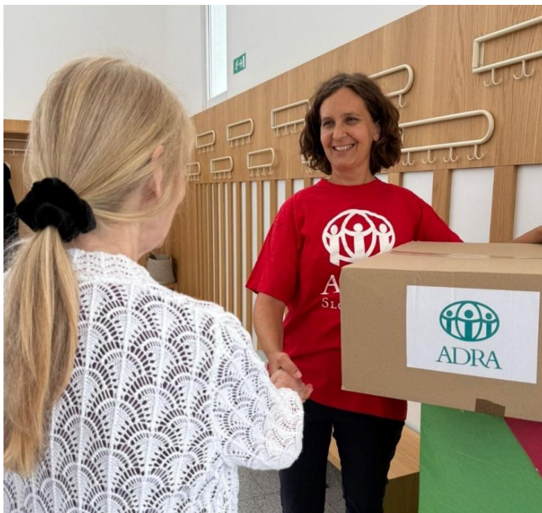
Slika: Programu dodeljevanja pomoči

Namen programa je prispevati k bolj zdravemu življenjskemu slogu, tako socialno ogroženih družin kot tudi splošnega prebivalstva, predvsem na področju zdravega prehranjevanja.