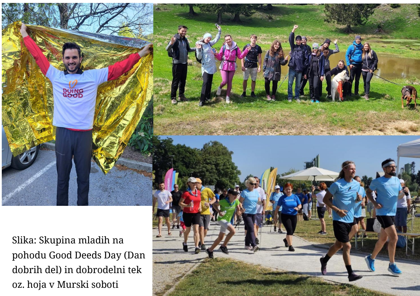
Slika: Skupina mladih na pohodu Good Deeds Day (Dan dobrih del) in dobrodelni tek oz. hoja v Murski soboti

V letu 2025 smo poleg razvijanja vsebin in strateškega načrtovanja na tem področju z mladimi preživeli aktiven dan v okviru akcije Good Deeds Day in počistili vso okolico na pohodu na Veliko planino. Obenem smo soorganizirali dobrodelni tek za OŠ v Murski Soboti, kjer se je k udeležbi še posebej spodbujalo družine z otroki in mladimi.