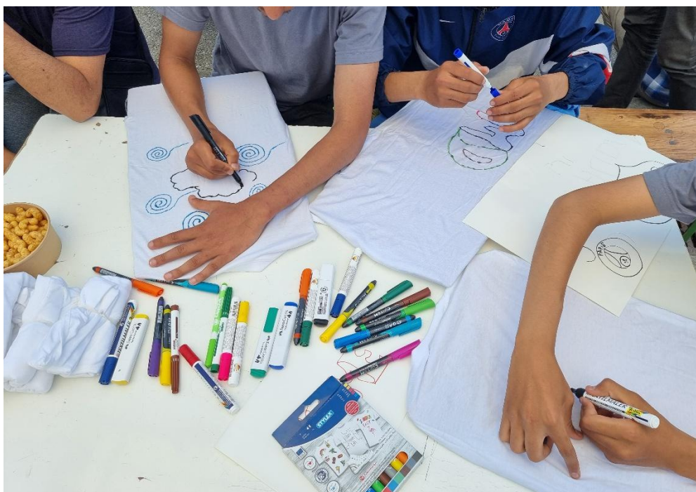
Slika: Delavnice ustvarjanja in psiho-socialne pomoči

Skupaj s Krščansko adventistično cerkvijo sedmega dne v Sloveniji smo zbrali in razdelili tudi večjo količino oblačil in obutve za nastanjene v Azilnem domu Vič ter za društvo KD Gmajna, katerega glavno poslanstvo, je pomoč migrantov v Sloveniji.