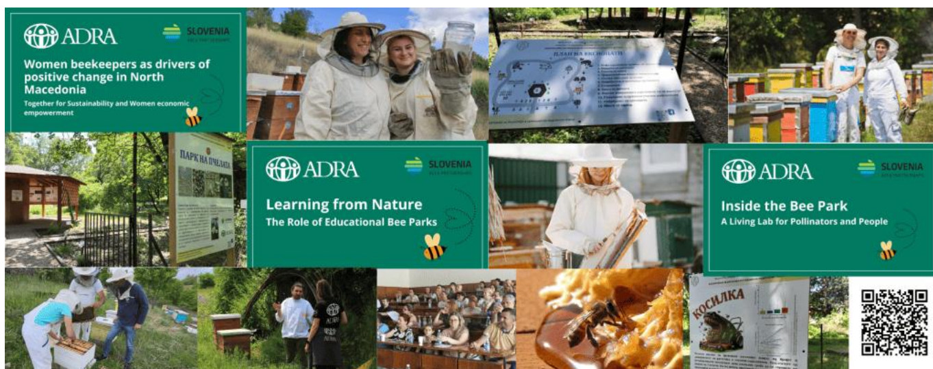
Slika: Različne aktivnosti projekta