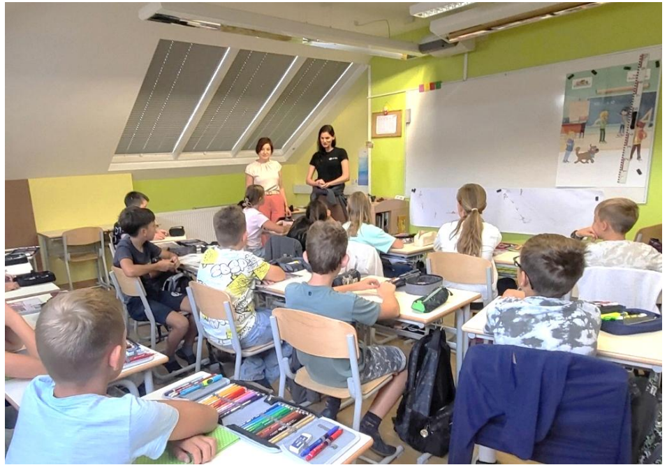
Slika: predstavitev dela ADRA Slovenija učencem OŠ Nova Cerkev