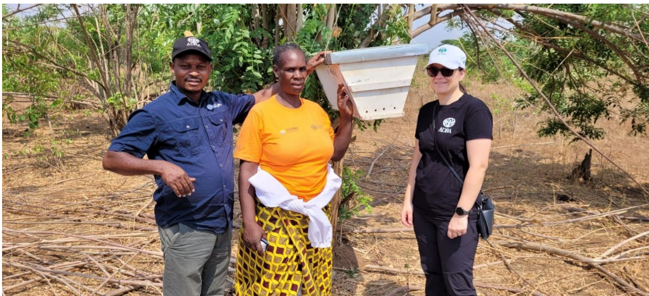
Slika : Obisk projekta v Zambiji

Projekt vključuje partnerje iz Zambije, Slovenije in lokalne strokovne institucije.