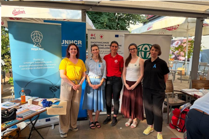
Slika: Ozaveščevalne aktivnosti

Ob Svetovnem dnevu beguncev, 20. junija, smo v ADRA Slovenija skupaj z Občino Postojna in drugimi partnerskimi organizacijami (UNHCR, IOM, Rdeči križ Slovenije) obeležili dan, posvečen pogumu, vztrajnosti in moči milijonov ljudi, ki so bili prisiljeni zapustiti svoj dom zaradi vojn, preganjanja ali nasilja.