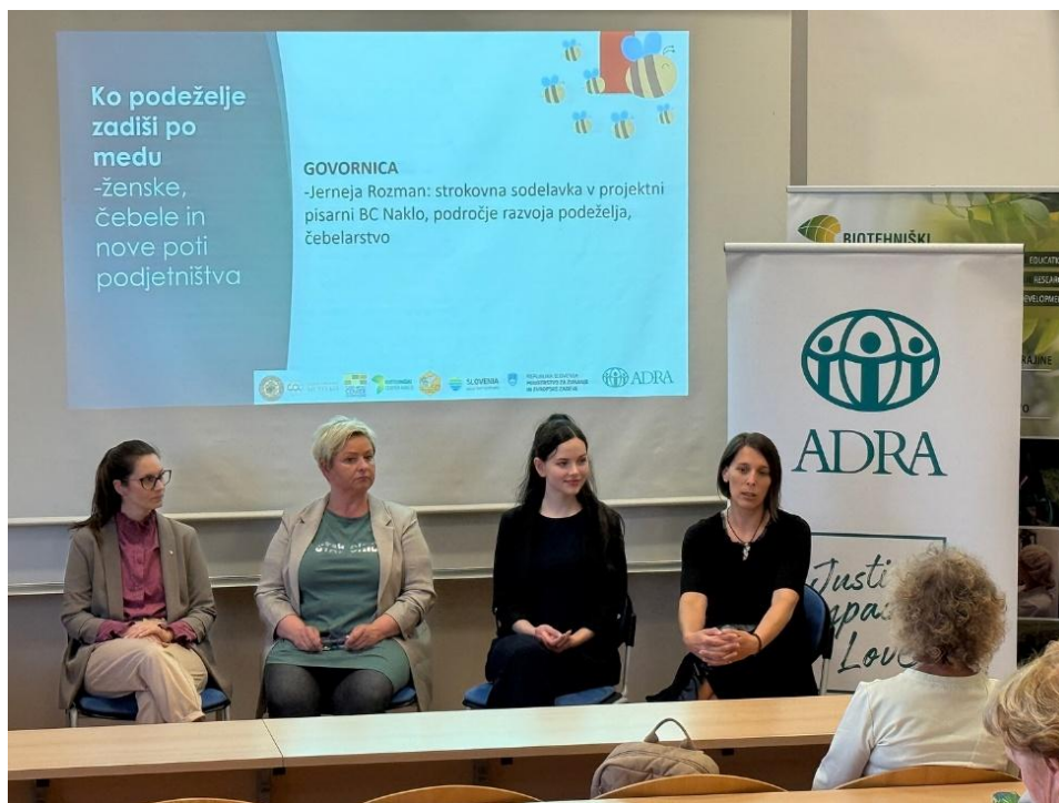
Slika: Ženske čebelarke govornice na ADRA Slovenija dogodku

Zunanji partnerji, ki predvsem preko IN-KIND donacij svojega časa in znanja prispevajo k projektu so bili: Čebelarstva zveza Slovenije, Čebelarstva zveza Gorenjske, Čebelarstvo razvojno-izobraževalni center Gorenjske, Biotehniški center Naklo, Ekološko čebelarstvo Metelko.