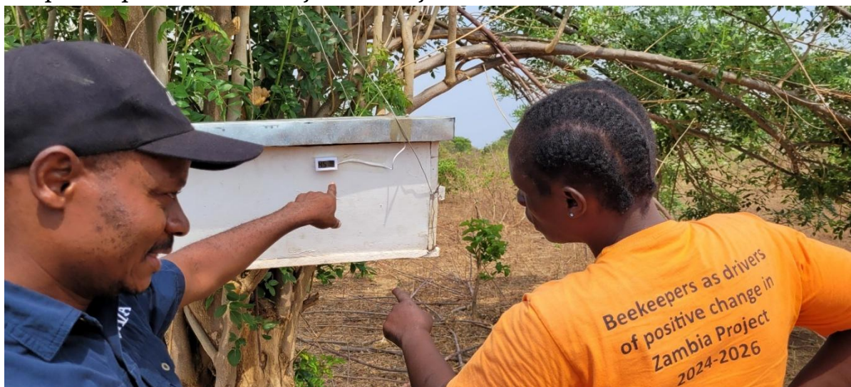
Slika: Projektni vodja ADRA Zambija in udeleženka projekta