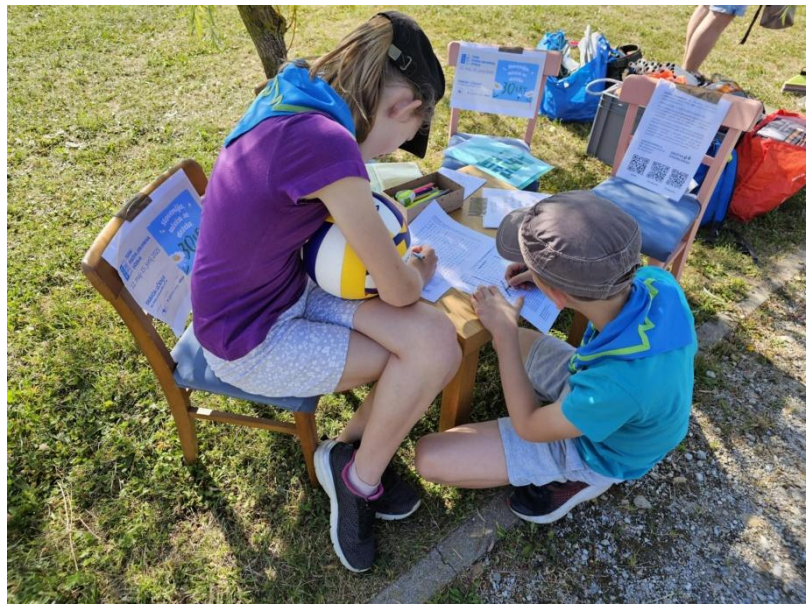
Slika: Mlada udeleženca delavnice GU

V letu 2025 so bile izvedene tri delavnice globalnega učenja za otroke in mlade v okviru projekta »Trajnostno. Lokalno. Globalno. II«, ki ga izvaja platforma SLOGA, financira pa Ministrstvo za zunanje in evropske zadeve RS.