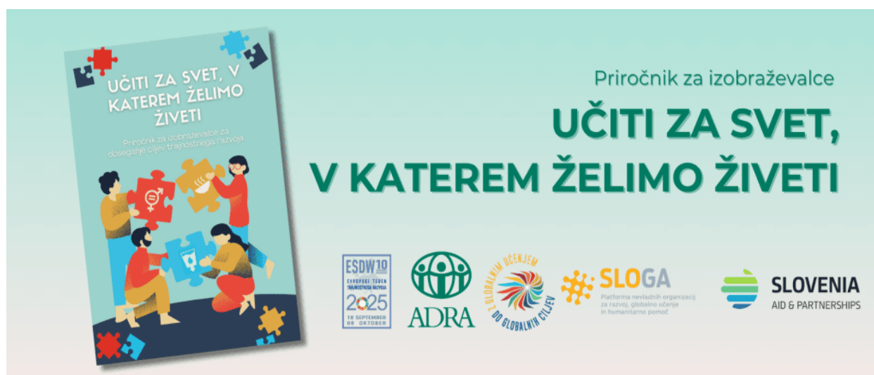
Slika: Priročnik za izobraževalce

praktično orodje, ki izobraževalcem pomaga krepiti razumevanje, kritično mišljenje in aktivno delovanje za pravičnejši ter trajnosten svet. Priročnik je izšel v okviru Evropskega tedna trajnostnega razvoja, pobude, ki povezuje dogodke in projekte po vsej Evropi z namenom spodbujanja ozaveščanja, učenja ter ukrepanja za trajnostno prihodnost, ter v sklopu projekta »Z globalnim učenjem do globalnih ciljev II«, ki ga izvaja platforma SLOGA, financira pa Ministrstvo za zunanje in evropske zadeve RS. Humanitarno društvo ADRA Slovenija je v sklopu projekta Z globalnim učenjem do globalnih ciljev II, pripravilo tri letake in tri e-gradiva za izobraževalce s področja globalnega učenja, ki vam bo v pomoč pri načrtovanju in izvajanju vsebin na temo prehranske varnosti, enakosti spolov in dostopa do čiste pitne vode.