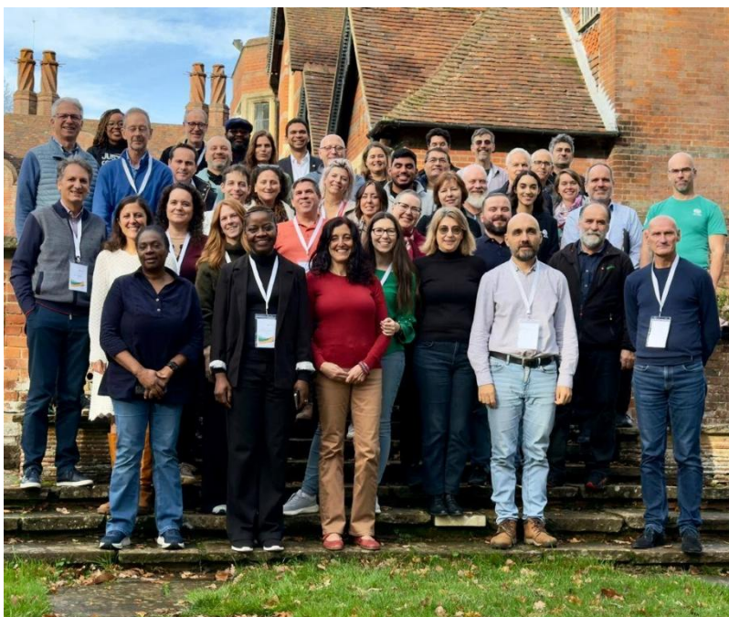
Sliki: Delavnice in forum ADRA članic regionalne pisarne v Evropi

Našo zavezanost k transparentnosti in kakovosti potrjuje tudi uvrstitev na seznam preverjenih humanitarnih organizacij na portalu Dobrodelen.si . Platforma deluje pod okriljem CNVOS in javnosti omogoča vpogled v delovanje zaupanja vrednih NVO.