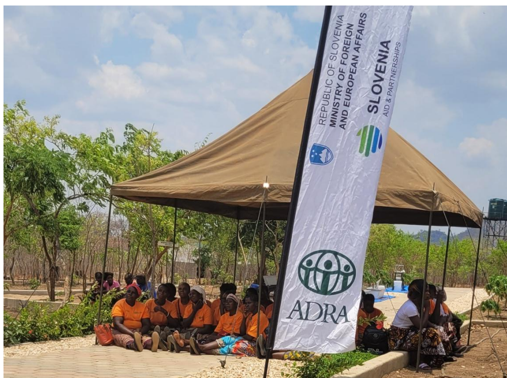
Slika: Udeleženke projekta v Zambiji

Projekt je v tem obdobju dosegel ali presegel vse načrtovane kazalnike , postavil temelje za podjetniški razvoj udeleženk ter zagotovil dolgoročno trajnost prek infrastrukture in lokalnega znanja.