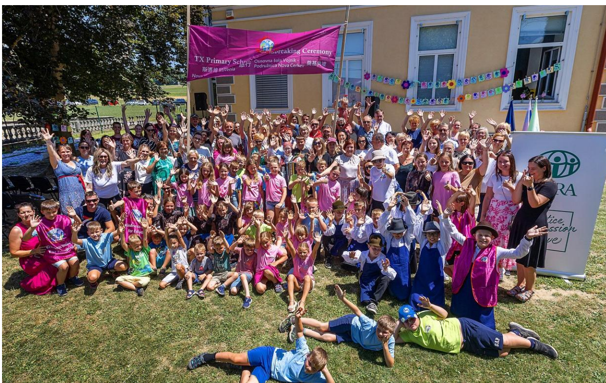
Slika: Otvoritev obnavljanja OŠ Nova cerkev skupaj s Fundacijo TX

Naše operacije so potekale tako v pisarni kot na terenu po celotni Sloveniji. Z ozaveščevalnimi aktivnostmi smo dosegli več kot 500.000 oseb splošne javnosti