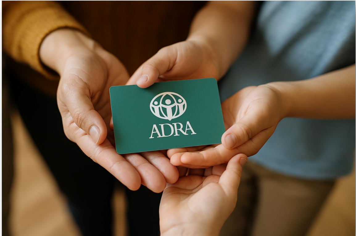
Slika: Simbolična slika

tem obdobju smo z vztrajnostjo, strokovnostjo in predanostjo razvili široko mrežo humanitarnih, razvojnih in izobraževalnih programov ter okrepili našo vlogo pri podpori najranljivejšim. Ključ našega napredka ostaja sodelovanje – povezanost z lokalnimi akterji, prostovoljci in člani društva, mednarodno ADRA mrežo, vladnimi institucijami in nevladnim sektorjem, ki nam je omogočilo večjo učinkovitost in dolgoročnejši vpliv.