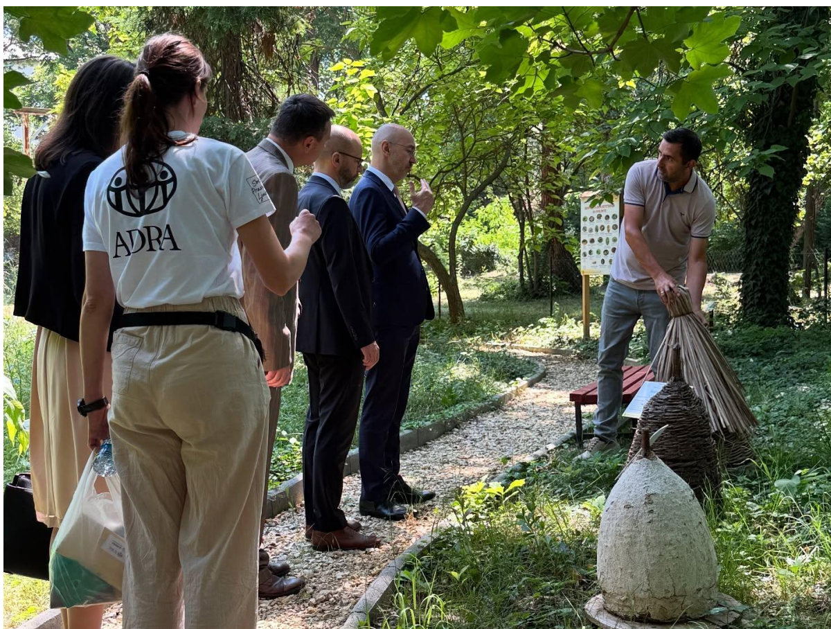
Slika: Obisk predstavnikov MZEZ na terenu in predstavitev projekta

Na področju mednarodnega razvojnega sodelovanja smo izvedli številne aktivnosti. Pod programom je ključno izvajanje dveh večjih razvojnih projektov z Ministrstvom za zunanje in evropske zadeve, direktoratom za razvojno sodelovanje in humanitarne pomoč. Projekta Čebelarke kot nosilke pozitivnih sprememb v Severni Makedoniji/Zambiji se zavzemata za doseganje rezultatov na dveh glavnih področjih, in sicer: 1.) zmanjšanje neenakosti med spoloma z opolnomočenjem žensk ter 2.) promocija in razvoj podeželja s spodbujanjem sonaravnega ekološkega čebelarstva in lokalnega trženja čebeljih izdelkov.