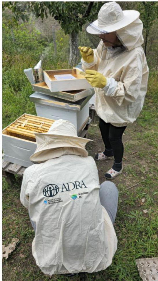
Slika: Udeleženka projekta že sama prideluje med