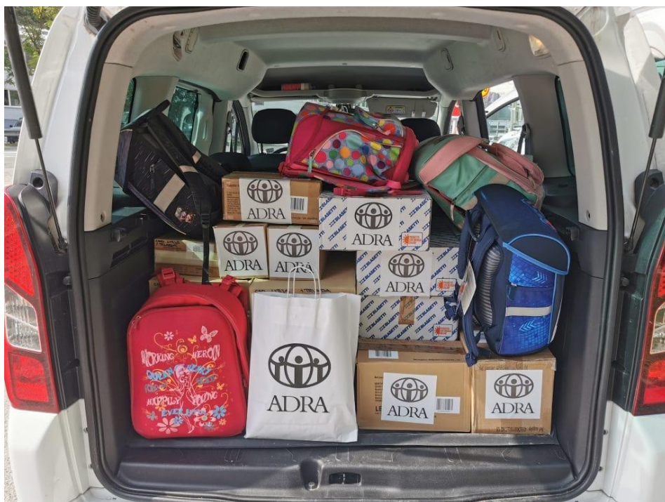
Slika: Paketi šolskih potrebščin za otroke po Sloveniji

Šolske potrebščine smo razdelili zaposleni in prostovoljci društva ADRA Slovenija, obenem pa smo sodelovali tudi s Centri za socialno delo Domžale, Maribor center, Zagorje, Trbovlje, Hrastnik ter namestitvenim centrom za begunske družine v Logatcu.