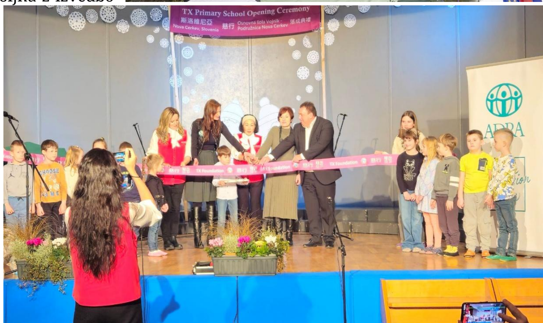
Sliki: Dogodka ob obnovi OŠ Nova cerkev