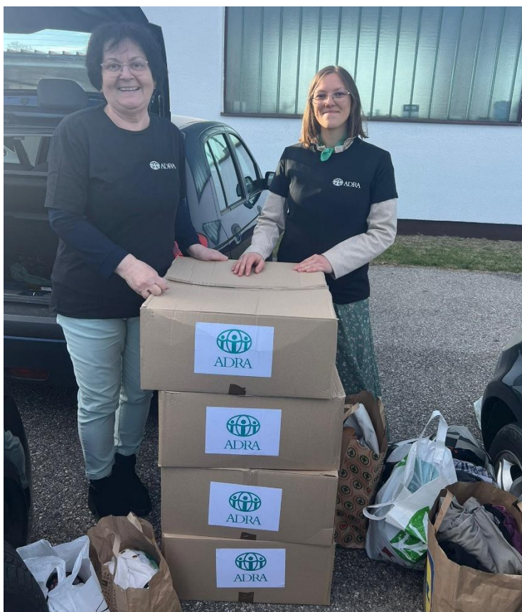
Sliki: Prostovoljska pomoč pri pakiranju in razdeljevanju pomoči

Tradicionalno pod programom izvajamo pod-program Solidarnost in tudi akcijo Ogrejmo jim srca, pri čemer družinam v stiski ob koncu leta pomagamo z osnovnimi paketi in vavčersko pomočjo.