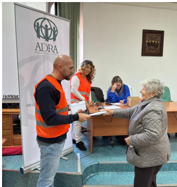
Slika: Podpora odzivu po poplavah ADRA BiH.

Pomoč za BiH smo namenili v letu 2025 in s tem delno tudi pomagali, da je ekipa ADRA BIH razdelila več kot 353 denarnih bonov za različne družine in posameznike, vsak bon je bil v vrednosti 76 €. Ti boni omogočajo dostojen nakup osnovnih potrebščin, ki jih prizadeti niso prejeli v paketih pomoči.