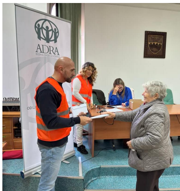
Slika: Podpora odzivu po poplavah ADRA BiH.

Pomoč za BiH smo namenili v letu 2025 in s tem delno tudi pomagali, da je ekipa ADRA BIH razdelila več kot 353 denarnih bonov za različne družine in posameznike, vsak bon je bil v vrednosti 76 €. Ti boni omogočajo dostojen nakup osnovnih potrebščin, ki jih prizadeti niso prejeli v paketih pomoči.