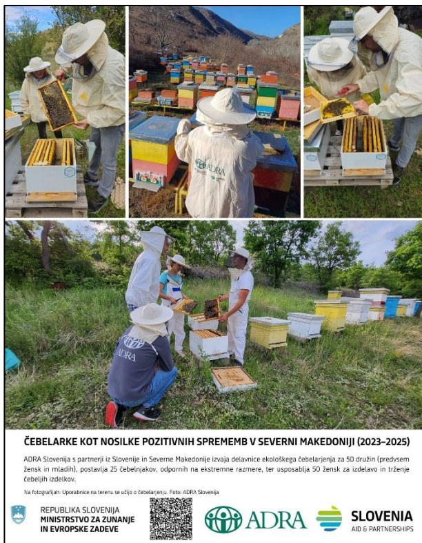
Slika: Aktivnosti projekta v Severni Makedoniji

V letu 2024 je več kot 50 uporabnic_kov in njihovih družin pridobilo osnovno znanje za čebelarjenje in ekološko pridelavo hrane. Poleg delavnic za opolnomočenje se je izvedlo dodeljevanje osnovne čebelarske opreme družinam, pri čemer se je z novimi panjim, mlado matico in čebeljo družino ter drugo osnovno opremo doseglo 44 družin .