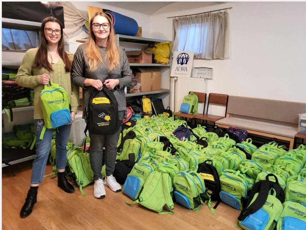
Slika: Šolske potrebščine v sodelovanju z jezikovno šolo Hellen Doron

Pri razdeljevanju smo sodelovali tudi s Centri za socialno delo Domžale, Kranj, Tržič, Zagorje, Ljubljana Moste-Polje ter Ljubljana Center.