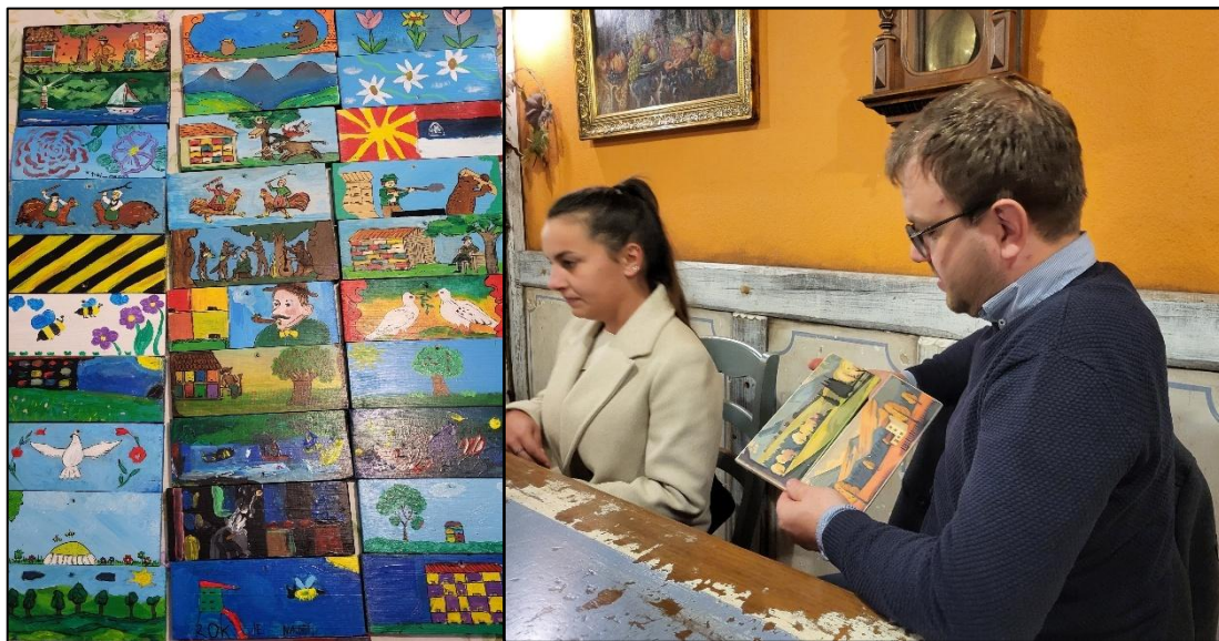
Slika: Panjske končice in izmenjava v znak dobrega sodelovanja

Zunanji partnerji, ki predvsem preko IN-KIND donacij svojega časa in znanja prispevajo k projektu so: Čebelarstva zveza Slovenije, Čebelarstva zveza Gorenjske, Čebelarski razvojno-izobraževalni center Gorenjske, Biotehniški center Naklo, Ekološko čebelarstvo Metelko.