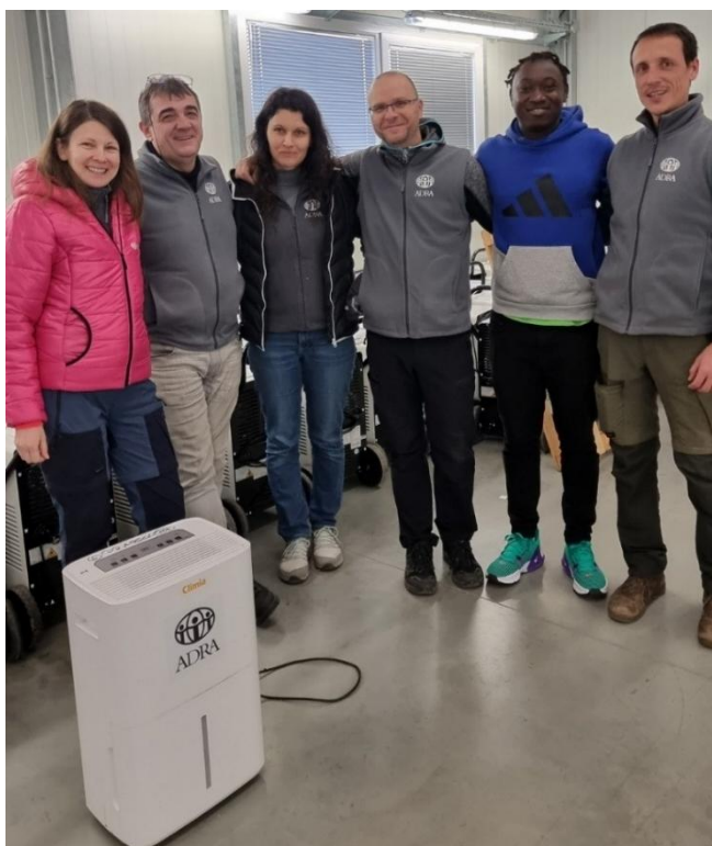
Slika: Prostovoljska ekipa za dodeljevanje pomoči

V času odzivanja so prostovoljci za 239 oseb (82 gospodinjstev) zabeležili 106,5 h izvedene laične psihosocialne podpore .