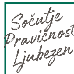
Slika 1: Moto organizacije ADRA

Ker verjamemo, da ima vsak človek pravico do dostojnega življenja, z zaupanja vrednim in učinkovitim delom skrbimo za najbolj ranljive posameznike ter skupine v Sloveniji in tudi po svetu.