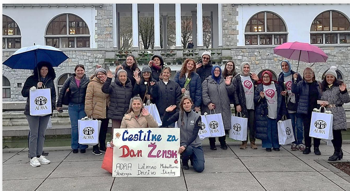
Slika: Obeležitev svetovnega dneva žensk

Ozaveščanje o problematiki migrantov je potekalo na več načinov. Pripravljene vsebine smo redno objavljali na naših spletnih omrežjih. V vsebinah smo se osredotočali na vzroke za migracije, primere uspešne integracije, odpravo sovražnega govora in nestrpnosti. Velik del aktivnosti je bil usmerjen v razbijanje mitov in predsodkov, odpravo stereotipov, nenasilno komunikacijo, odprt dialog, pojav diskriminacije ter njeno odpravo.