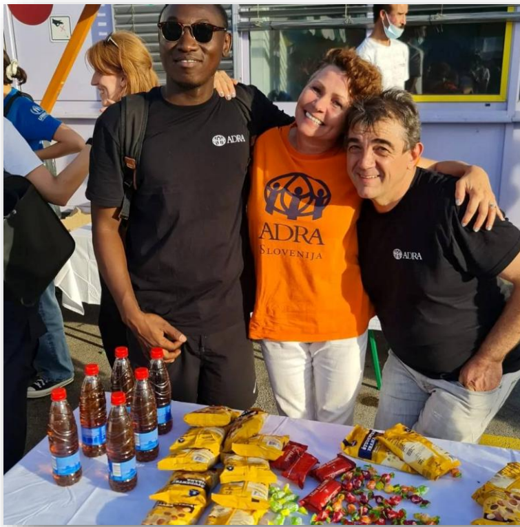
Slika: Prostovoljci društva ADRA Slovenija

Društvo je v letu 2024 zaposlovalo 4 osebe, občasno je pomoč nudila 1 oseba preko študentskega dela. Delo je potekalo v sodelovanju z rednimi prostovoljci, zabeležili smo ure 20 prostovoljcev, ki so skupaj opravili 1959 ur v skupni vrednosti 16.221€ . Izvajale so se dnevne operacije v pisarni in na terenu v Sloveniji. Skupaj smo v letu 2024 dosegli in v svojih programih zabeležili doseg za več kot 1810 neposredno udeleženih oseb na naših aktivnostih in obenem v posebnem poročilu o dosegu odziva po posledicah poplav 970 gospodinjstev ter več kot 2700 posameznih oseb 1 . Z ozaveščevalnimi aktivnostmi smo dosegli več kot 200.000 oseb splošne javnosti .