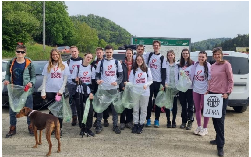
Slika: Skupina mladih na pohodu Good Deeds Day (Dan dobrih del)

V letu 2024 smo poleg razvijanja vsebin in strateškega načrtovanja na tem področju z mladimi preživeli aktiven dan v okviru akcije Good Deeds Day in počistili vso okolico na pohodu na Limbarsko goro ter okoli Gradiškega jezera.