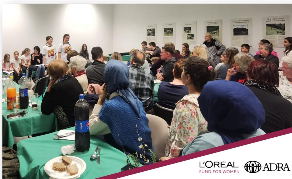
Slika: Medkulturni dogodek z društvom Medkulturni dialog