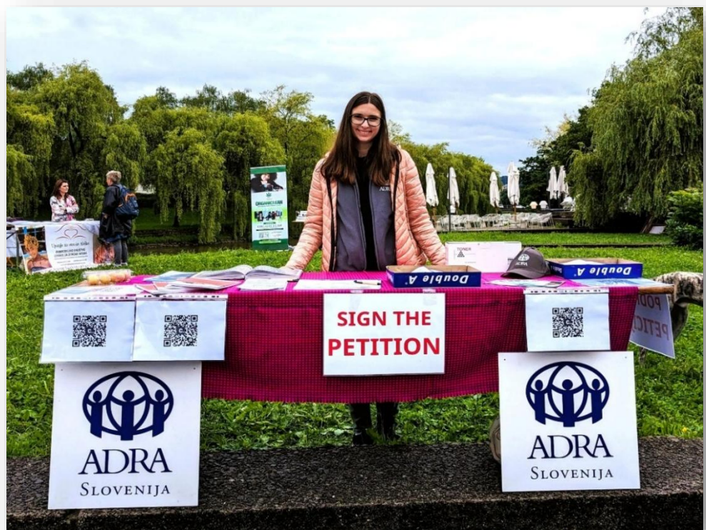
Slika: Zagovorniške aktivnosti projekta BODE+

V omenjenem projektu so se nam pridružila še društva KD Gmajna, Infokolpa, Zavod Apis, Latinsko društvo, sodelujejo druga društva s sorodnimi vsebinskimi usmeritvami.