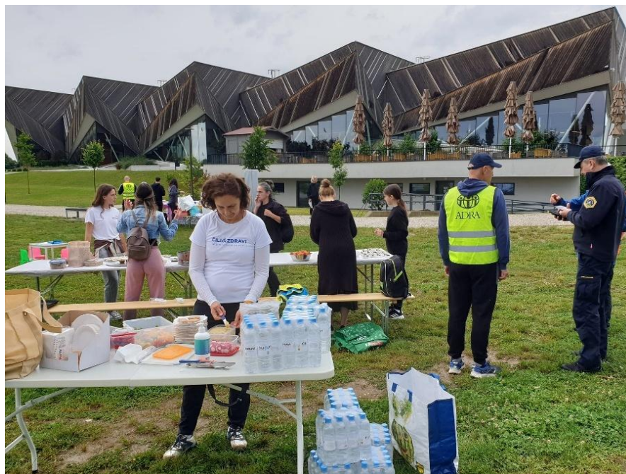
Slika: Dobrodelni tek in poziv k zdravemu načinu življenja

Humanitarno društvo ADRA Slovenija izvaja različne aktivnosti, katerih namen je udeležence usposobiti in izobraziti glede zdrave in cenovno ugodne priprave hrane ter zdravega življenjskega sloga.