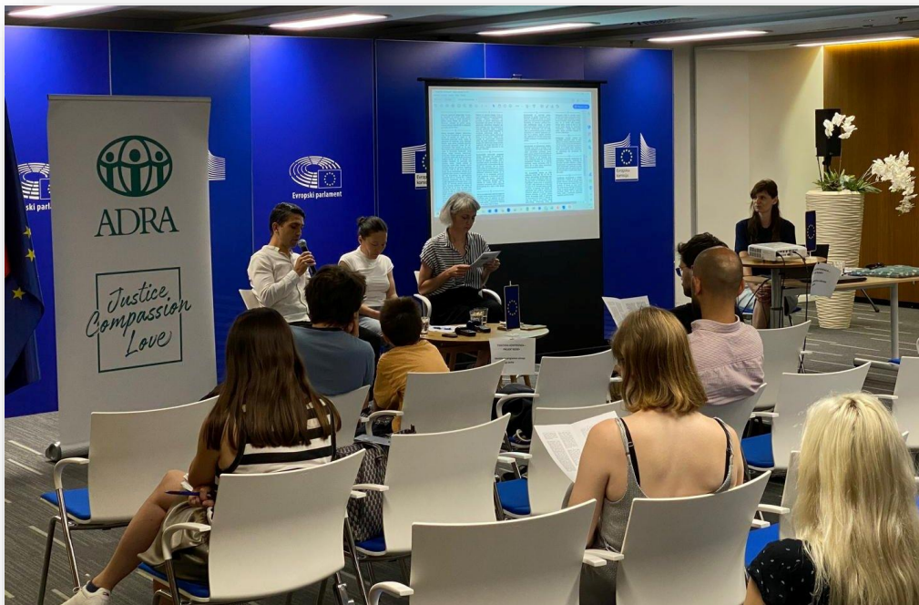
Slika: Tiskovna konferenca