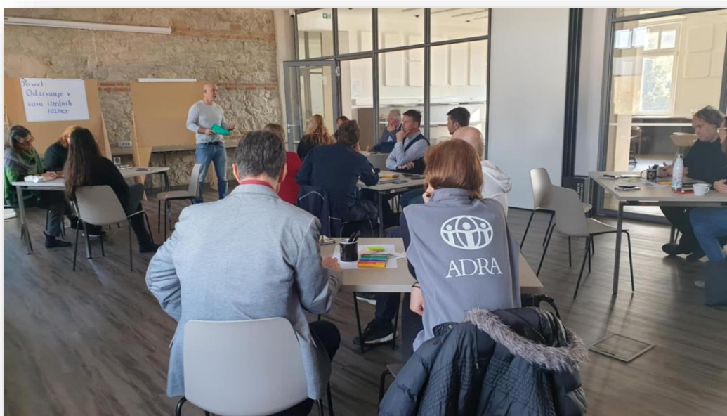
Slika: Posvet z različnimi deležniki na temo odzivov na krize v Sloveniji

ADRA Slovenija je v letu 2024 krepila kapacitete na področju odziva na katastrofe in krize, pri čemer smo se povezali z drugimi nevladnimi organizacijami ter tudi regionalnimi stičišči, občinami ter Civilno zaščito. Izvedli smo delavnico za prostovoljce na temo Emergency Response Managementa skupaj s Slovensko filantropijo.