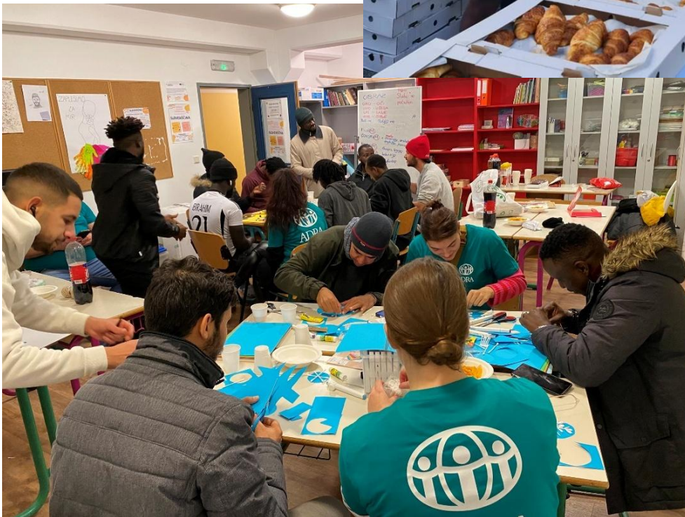
Sliki: Delavnice psiho-socialne pomoči in obeleževanje Svetovnega dneva beguncev

Skupaj z UOIM smo zbrali in razdelili tudi večjo količino oblačil in obutve za nastanjene v Azilnem domu Vič ter Logatec.