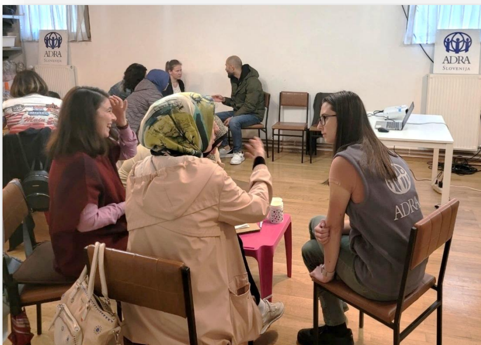
Slika: Delavnice PSS z ranljivimi ženskami