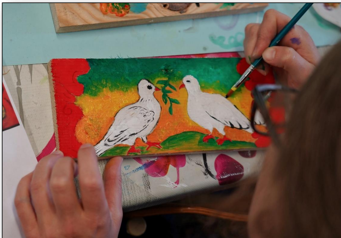
Slika: Panjske končice v znak prijateljstva

Ob koncu leta smo oblikovali tudi strateški načrt in smernice za delovanja društva, ter pripravili vsebinski ter finančni načrt za leto 2025.