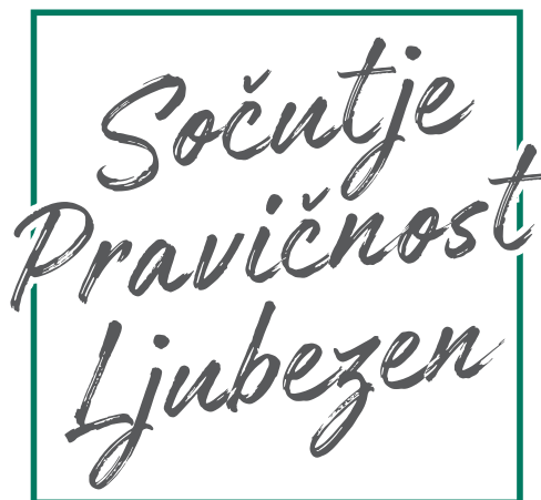
Slika 1: Moto organizacije ADRA

Ker verjamemo, da ima vsak človek pravico do dostojnega življenja, z zaupanja vrednim in učinkovitim delom skrbimo za najbolj ranljive posameznike ter skupine v Sloveniji in tudi po svetu.