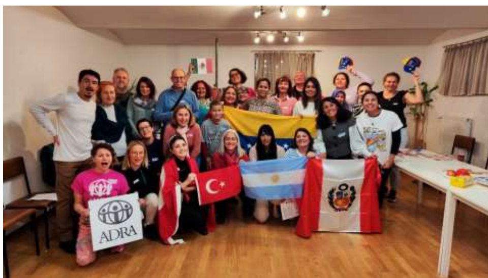
Slika: Medkulturno druženje

Še naprej smo se povezovali z društvom Medkulturni dialog, ki združuje begunce iz Turčije in izvajali integracijske aktivnosti ter socialno aktivacijo. Tesno partnerstvo pa smo razvili tudi z Latinskim društvom, ki združuje osebe iz latinske Amerike.