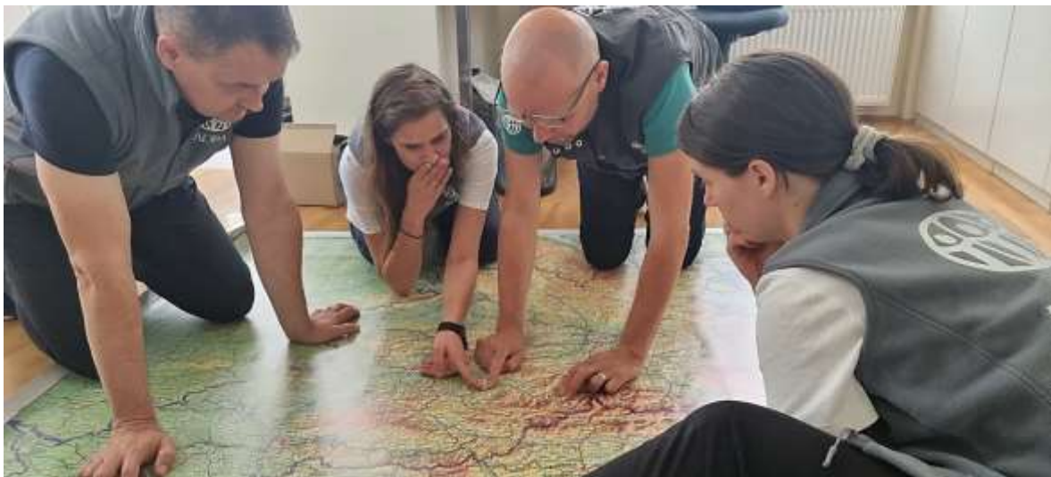
Slika: Strateško načrtovanje odziva

ADRA Slovenija je takoj ob začetku poplavljanja po Sloveniji začela s strateškim odzivom v kriznih situacijah. V prvem delu odziva na ujmo smo odšli na teren in naredili natančno oceno potreb, se začeli povezovati s civilno zaščito in lokalnimi oblastmi, nemudoma sprožili zbiralno akcijo finančnih sredstev za pomoč prizadetim gospodinjstvom v poletnih neurjih ter se povezali z mrežo ADRA Europe, natančneje Emergency Response Unit-om, ki predstavlja usposobljeno skupino posameznikov, ki pomagajo v primerih odzivanja na krizne situacije.