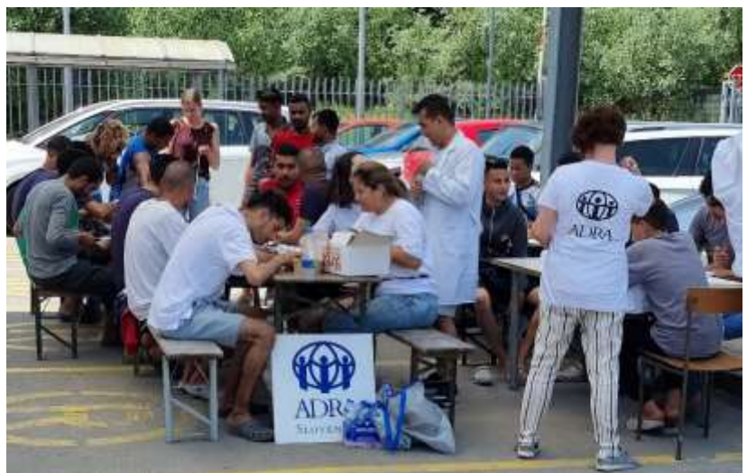
Slika: Aktivnosti v Azilnem domu Vič

Pomoč smo redno na tedenski ravni izvajali tudi v letu 2023. Preko študentskega dela, prostovoljskega sodelovanja ter posebnih delavnic skupaj z UNHCR smo na Svetovni dan beguncev izvedli 40 delavnic , pri čemer smo dosegli okoli 380 migrantov nastanjenih v Azilnem domu Vič.