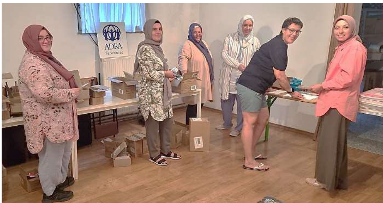
Slika : Pakete šolskih potrebščin smo pripravili v sodelovanju z Društvom Medkulturni dialog

Pri analizi potreb in razdeljevanju potrebščin smo sodelovali z UOIM, Veleposlaništvom Ukrajine v Sloveniji, nadaljevali pa smo tudi z uspešno vzpostavljenim dolgoletnim sodelovanjem s Centri za socialno delo in osnovnimi šolami oz. njihovimi strokovnimi delavci po različnih območjih v Sloveniji. Skupaj z njihovo pomočjo smo poskrbeli, da so bili upravičenci tisti, ki to najbolj potrebujejo. Pomagali smo otrokom in družinam iz cele Slovenije – od Savinjske regije, Gorenjske, Koroške regije – in s tem poskrbeli za geografsko porazdelitev.