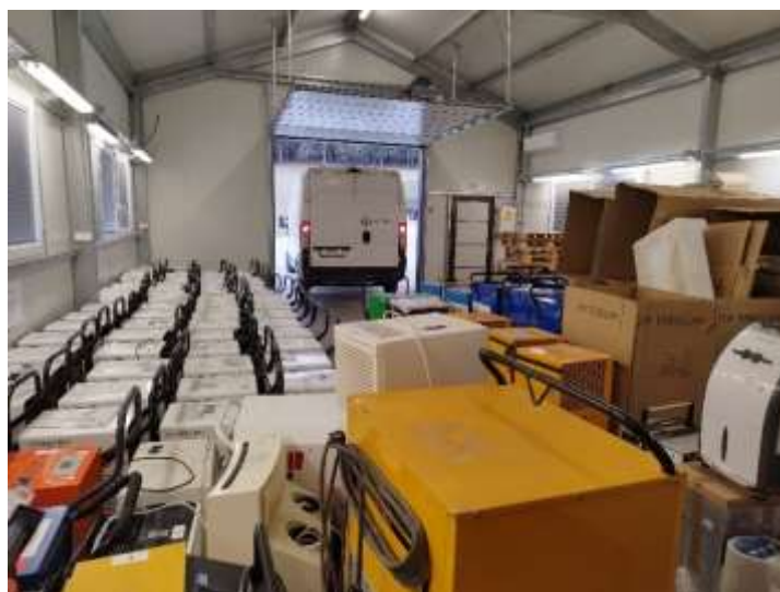
Slika: Razvlažilne naprave