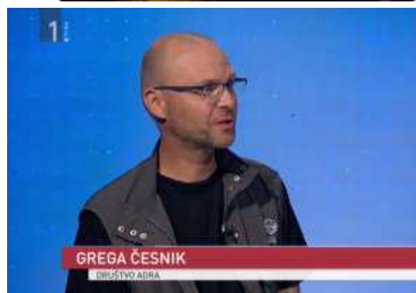
Slika: Različne objave v medijih

Poleg javnih medijev, se je javnost osveščala tudi preko socialnih medijev, novičnikov, internetne strani, YouTube kanala. Od leta 2019 smo skupaj zabeležili več kot 2 milijona ogledov naših obvestil in novic iz strani posameznikov. Prav posebej smo ponosni na sodelovanje z drugimi nevladnimi organizacijami in večjimi podjetji, ki podpirajo naše humanitarne programe.