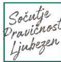
Slika 1: Moto organizacije ADRA

Ker verjamemo, da ima vsak človek pravico do življenja in dostojanstva, z zaupanja vrednim in učinkovitim delom skrbimo za pozabljene in najbolj ranljive posameznike ter skupine.