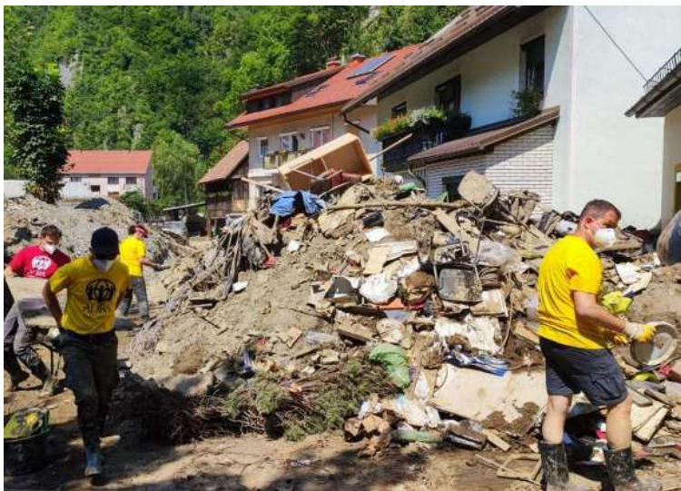
Slika: Delovna akcija na terenu

- Razdelili smo higienske pripomočke za 120 gospodinjstev in posameznikov.