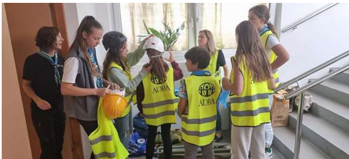
Slika : Skupina otrok na vikendu v Mariboru, ki se pripravljajo na simulacijo kriznega odziva

Program vikenda se je raztezal od sobote do nedelje. Vikende so otroci preživljali v naravi in krepili svoje motorične kompetence ter spoznavali nove veščine.