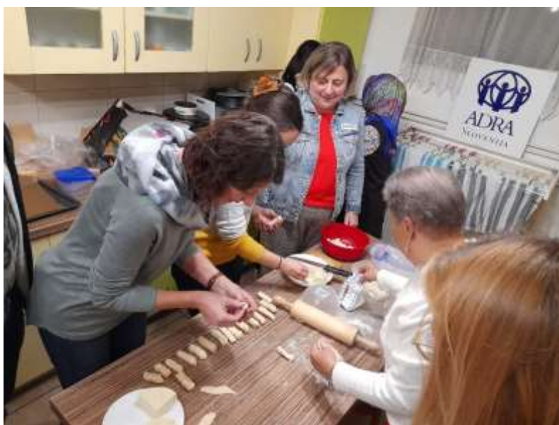
Slika: Kuharska delavnica

V okviru programa je bilo izvedeno 7 delavnic za 67 staršev oz. skrbnikov, starih staršev in posameznikov v Murski Soboti. Med delavnicami smo udeležence spodbudili k spremembam določenih navad za bolj zdravo in funkcionalno življenje ter vsakodnevno gibanje na svežem zraku. Udeleženci so prejeli brezplačen izvod revij Čili