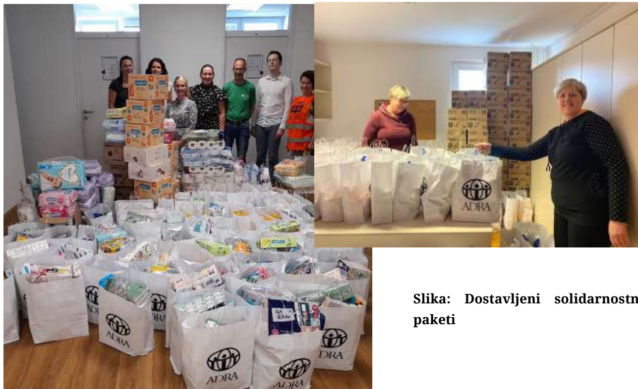
Slika: Dostavljeni solidarnostni paketi

Med vsemi prejemniki je 24 gospodinjstev prejelo higienske pakete s pomočjo FIHO sredstev.