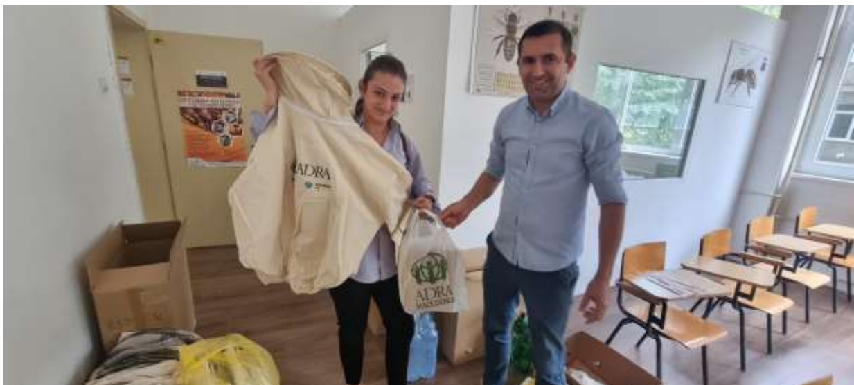
Slika: MRS v Severni Makedoniji

Potrebe po podpori ranljivim skupinam, predvsem ženskam in mladim smo prepoznali tudi v Severni Makedoniji, kjer smo skupaj z Ministrstvom za zunanje in evropske zadeve ter ADRA Makedonija začeli z izvajanjem razvojnega projekta.